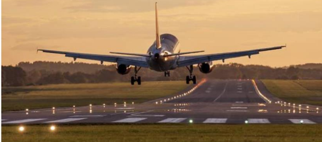
Politikere og embedsfolk fra Fredensborg Kommune flyver til KL-konferencen i Aalborg, men kompenserer for klimabelastningen.